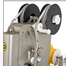
Accessoire du clip rouleau pour une haute production.