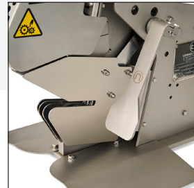
Palanca para el cierre automático del producto.