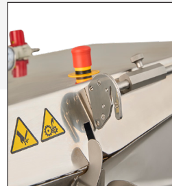
Cuchilla para cortar el sobrante de tripa.