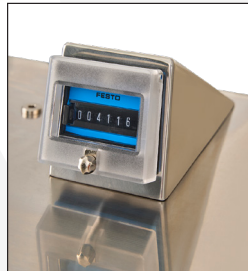
Contador de piezas.