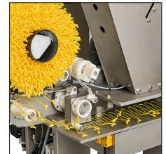
Accesorio alimentador de lazos automático.