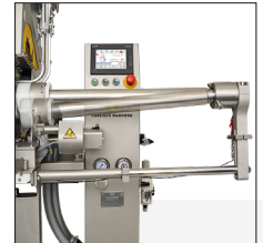
Giro del tubo de embutición para reducir roturas en tripas delicadas y centrar el clip.